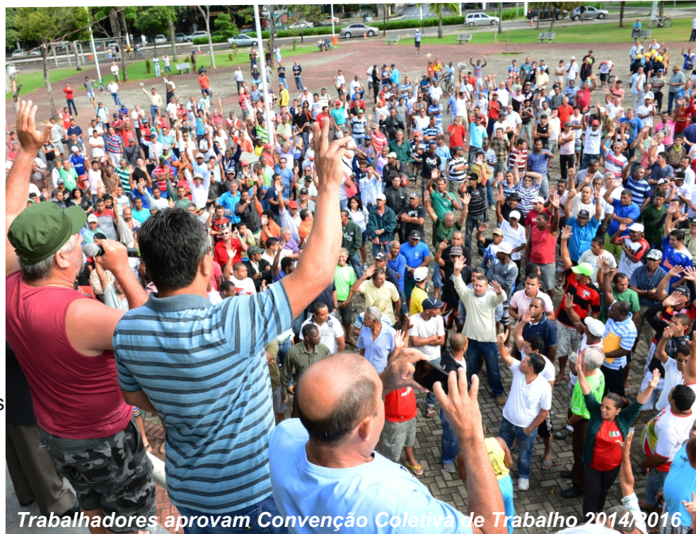
Trabalhadores aprovam Convenção Coletiva de Trabalho 2014/2016

totaliza R$ 320,00 para a alimentação, já que a assiduidade foi desmembrada da alimentação. Têm direito a 100% quem não tiver nenhuma falta, a 50% para que tiver uma ou duas faltas e 0% para que tiver mais de duas faltas. Vale lembrar que falta justificada não é falta).