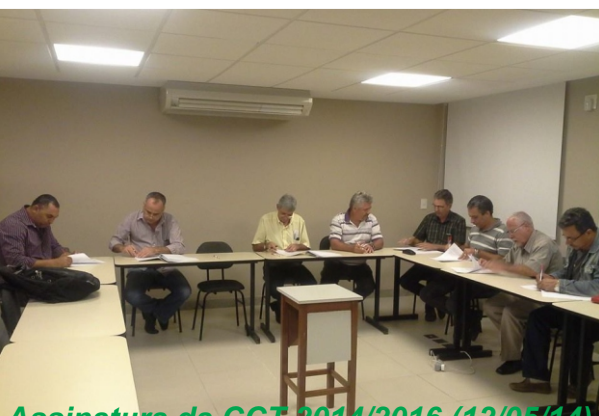
Assinatura da CCT 2014/2016 (12/05/14)

Com essa CCT fechada, a categoria mostrou mais uma vez que tem disposição de luta e que não foge da raia. Parabéns a todos. No ano que vem estaremos de novo, em nova campanha salarial.