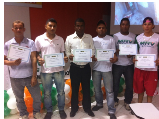
Formandos do Curso de Pedreiro

Essa é uma parceria Sintraconst/ES, IFES, MRV e Secretaria Municipal de Trabalho da Serra. Parabéns aos formandos. Quem luta também educa!