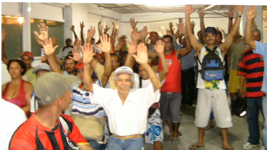
Assembléia discute PR no auditório do Sintraconst

O Sintraconst tem realizado assembléias em todas as obras para formar comissões por empresa para o acompanhamento da PR 2009, de acordo com a cláusula 14 da Convenção Coletiva de Trabalho. Nas assembléias o sindicato apresenta seu programa de PR, segundo o qual o trabalhador acidentado não perde o direito à PR e nem a trabalhadora gestante.