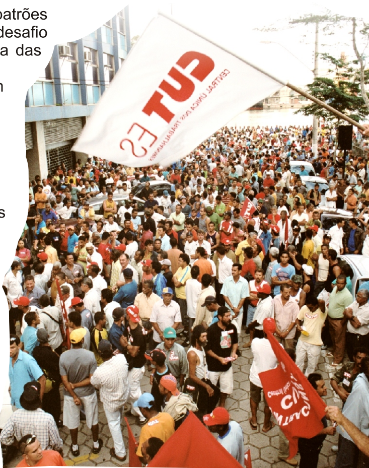
Nossas mobilizações garantem conquistas

Atenção companheiros, dia 1º de maio também é dia de votarmos sobre a manutenção da taxa de fortalecimento sindical (1%).