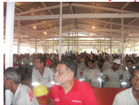
Operários da MLI participando de palestras

Com o objetivo de alertar os trabalhadores e conscientizar as empresas que ainda não adotaram o uso de Equipamentos de Segurança, o Sintraconst/ES e algumas instituições realizaram palestras na obra da MLI, que fica em Frente à Universidade de Vila Velha (UVV). Logo após uma tenda foi montada na Praça Costa Pereira, em Vitória, para tirar dúvidas e distribuir materiais sobre a campanha. Queremos agradecer a presença de todos e todas que estiveram presentes na Praça lembrando as vítimas e lutando pela vida, em defesa dos direitos e contra a exploração.