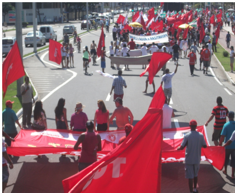
Companheiros em Passeata nas ruas de Camburi

Logo após a caminhada os companheiros presentes puderam curtir os shows das bandas capixabas Dallas Company e Macucos.