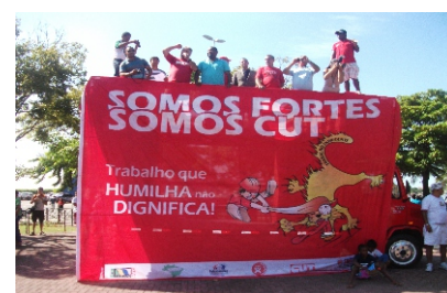
Assembleia na Praça dos Namorados

Queremos agradecer a todos vocês companheiros pela confiança no nosso sindicato.