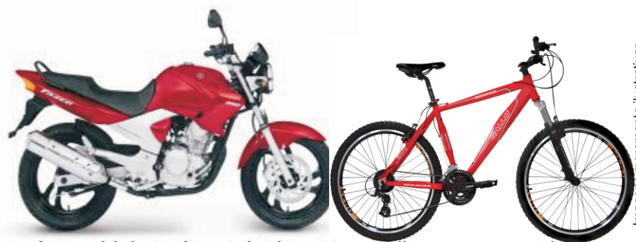
Assembleia terá sorteio de motos e bikes para associados

Ônibus exclusivos para o dia sairão de Anchieta, Guarapari e Aracruz. Não deixe de participar.