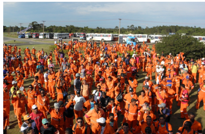
Greve na Paranasa garantiu pagamento de salários