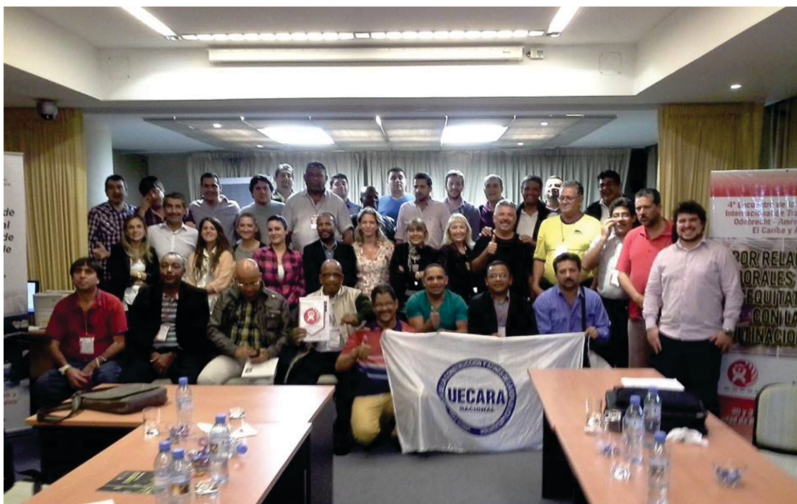
Encontro internacional reuniu lideranças latino-americanas, Caribenhas e africanas

Como principal encaminhamento do encontro, consta que a Odebrecht deverá assinar um acordo de alcance global, com garantia de direitos iguais para todos os seus operários, em qualquer parte do mundo onde ela esteja atuando. O prazo para que isso aconteça é março de 2015. Caso ela não assine, a rede sindical vai conchamar greves e paralisações em todos os países em que a Odebrecht estiver atuando.