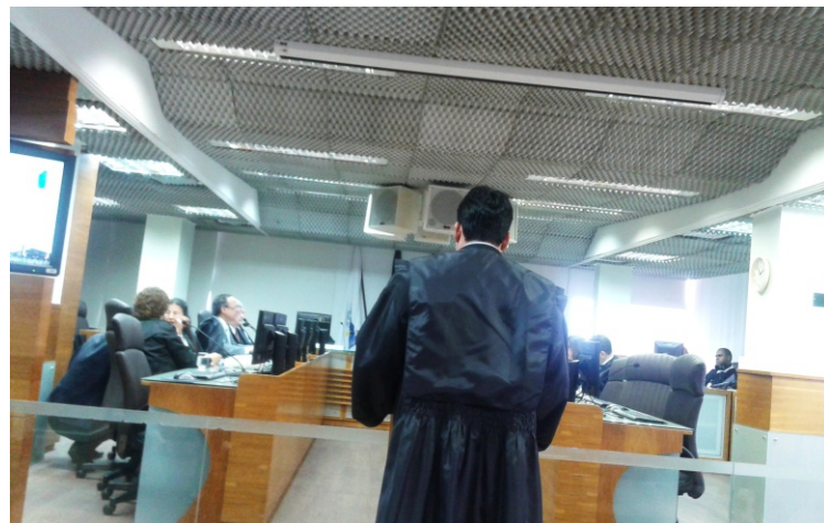
Assessoria jurídica do sindicato em ação

os trabalhadores da MRV e empreiteiras. Trata-se da proibição de essas empresas cortarem os dias parados na greve que aconteceu no mês de setembro, em canteiros de obras da Grande Vitória.