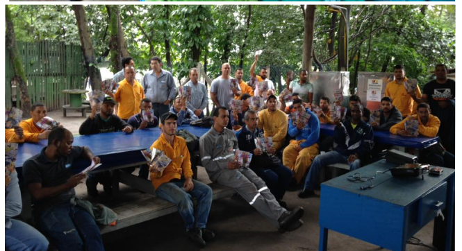
Assembleias falam sobre o impacto da reforma e o fim de direitos