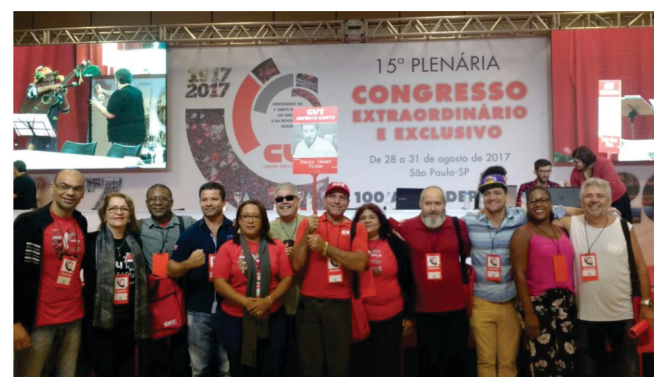
Delegação capixaba no congresso extraordinário

De 28 a 31 de agosto desse ano aconteceu em São Paulo a 15ª Plenária e o Congresso Extraordinário e Exclusivo da CUT para debater a conjuntura e encaminhar lutas para a classe trabalhadora brasileira.